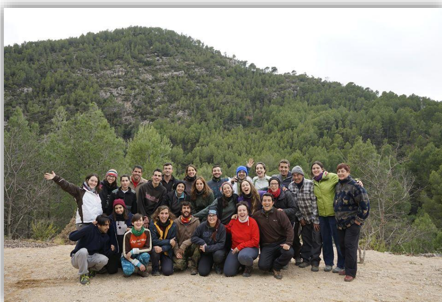
La “foto familiar” del equipo de esta edición.

Otros datos: Dos de las personas participantes ya habían participado en otras ediciones del Projecte Lligabosc. Es un logro importante porque demuestra que el proyecto agrada a la gente, que tiene ganas de ver el progreso de la gestión y de participar de nuevo.